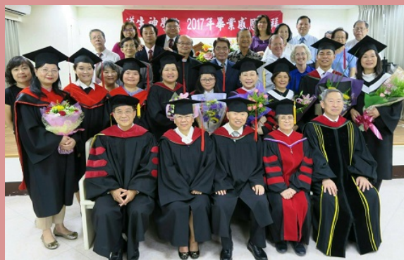
畢業典禮牧長、師生合照 06.17

末了，不能不說的就是 6.28 學生們給我一個「驚喜」，為我慶祝生日，當天我實在是很累，似乎沒有體力和心情參加，但是熬不過學生會長與阿真的盛情邀請，又剛好瑞亨也回到家，就陪我一起前往教室。我請老師同學們每一位都送我一句經文給我，作為生日禮物，因為「主的言語比精金更寶貴，比蜜更甘甜。」領受從師生口中所說出生命的話語，原本疲累的我，竟然立時「活」起來，把每句主話都記住了，與親愛的代禱勇士們分享！